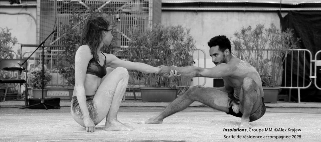
Insolations , Groupe MM, ©Alex Krajew Sortie de résidence accompagnée 2025